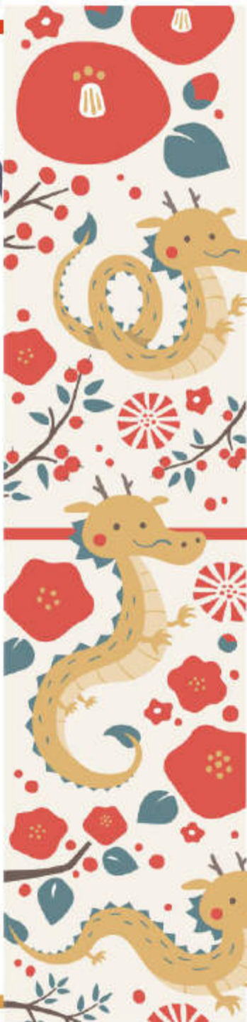
イラスト コウヤマトシヤ