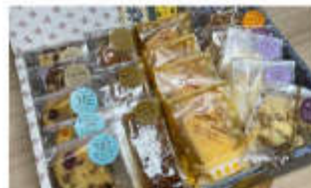
焼き菓子の詰め合わせ